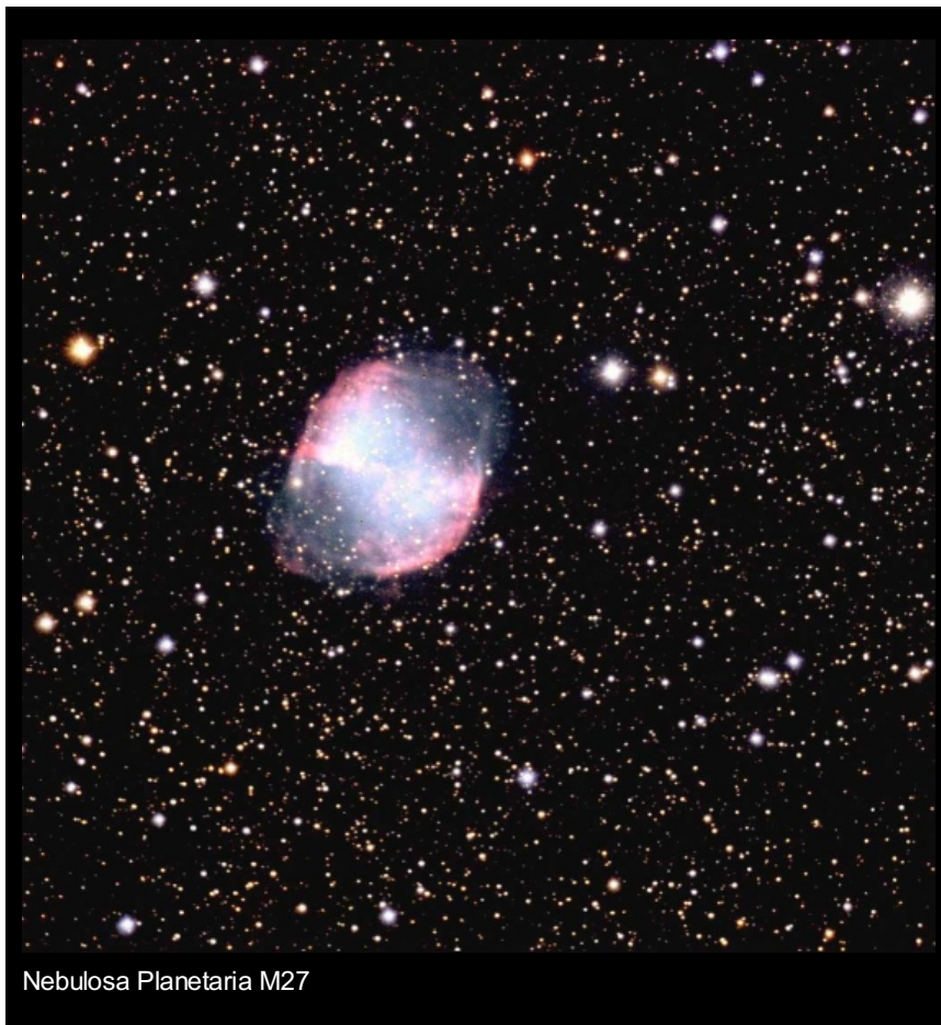
Nebulosa Planetaria M27